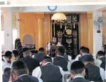
כולל הוראה "תפארת בנימין"