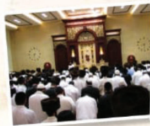
חלוקת קמחא דפסחא ועזרה לנטקיים בית הכנסת הגדול "היכל הקודש"