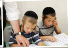
מוסדות חינוך לבנים