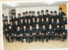
שיבה לבחורים "תפארת מורא"ש