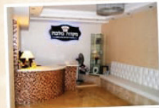
מקום מלכה המסוגל לפקידת עקרות