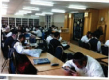
כולל אברכים "אור המאיר"