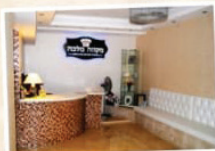
מקוה מלכה המסוגל לפקידת עקרות