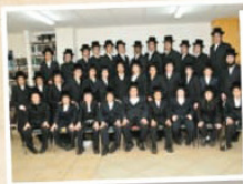
ישיבה לבחורים "תפארת מוהר"אש"