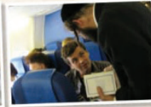
הפצת ספרי רבנו ד"ל