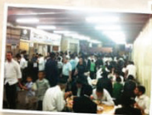
בית התבשיל "אהל אברהם"