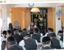
כולל הוראה "תפארת בנימין"