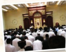
חלוקת קמחא דספחא ועזרה לנוקמים בית הנבסח הגדול "היכל הקודש"