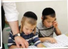
מוסדות חינוך לבנים