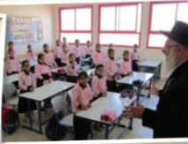
מוסדות חינוך לבנות