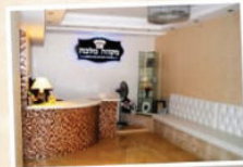
מקום מלכה המסוגל לפקידת עקרות