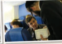
הפצת ספרי רבנו ז"ל