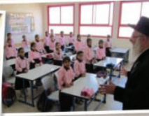
מוסדות חינוך לבנות