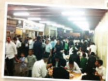
בית התבשיל "אהל אברהם"