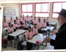
מוסדות חינוך לבנות