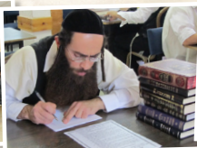
כולל הוראה "תפארת בנימין"