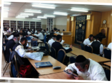
כולל אברכים "אור המאיר"