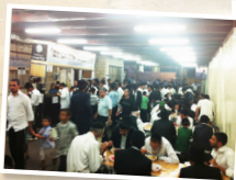
בית התבשיל "אהל אברהם"