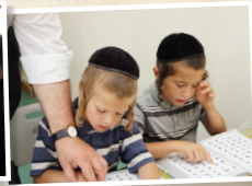
מוסדות חינוך לבנים