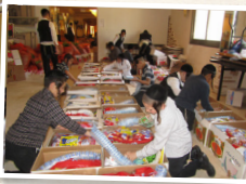
חלוקת קמחא דפסחא ועזרה לנוקמים