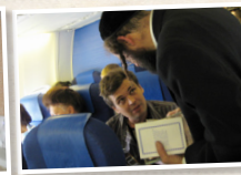
הפצת ספרי רבנו ז"ל