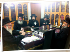
בית הוראה "צדק ומשפט"