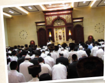
בית הכנסת הגדול "היכל הקודש"