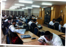
כולל אברכים "אור המאיר"