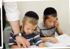
מוסדות חינוך לבנים