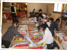
חלוקת קמחא דפסחא ועזרה לנוקמים