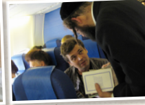
הפצת ספרי רבנו ז"ל