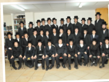
ישיבה לבחורים "תפארת מוהראש"