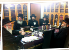
בית הוראה "צדק ומשפט"