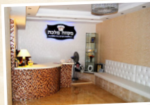
מקוה מלכה המסוגל לפקידת עקרות