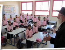
מוסדות חינוך לבנות