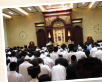
בית הכנסת הגדול "היכל הקודש"