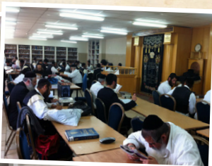
כולל אברכים "אור המאיר"