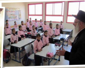
מוסדות חינוך לבנות