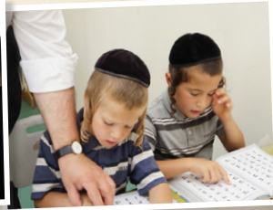
מוסדות חינוך לבנים