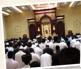
בית הוראה "צדק ומשפט" חלוקת קמחא דפסחא ועזרה לנזקקים בית הכנסת הגדול "היכל הקודש"