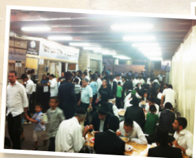
בית התבשיל "אהל אברהם"