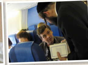
הפצת ספרי רבנו ז"ל