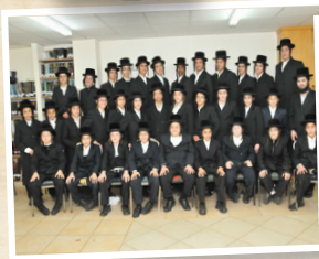
שיבה לבחורים "תפארת מוהרא"ש"