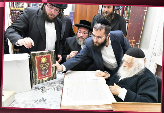
מרו שר התורה הגר"ח קנייבסקי שליט"א מקבל את האוצר מהמוציאים לאור, והפסידו בהתפעלות: צריך ללמוד בזה בכל יום!